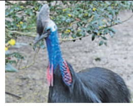
Casuario común Nueva Guinea y Australia No tiene alas, mide 1,5 metros y posee una cresta para abrirse camino por la selva. Se enfurece ante cualquier imprevisto.