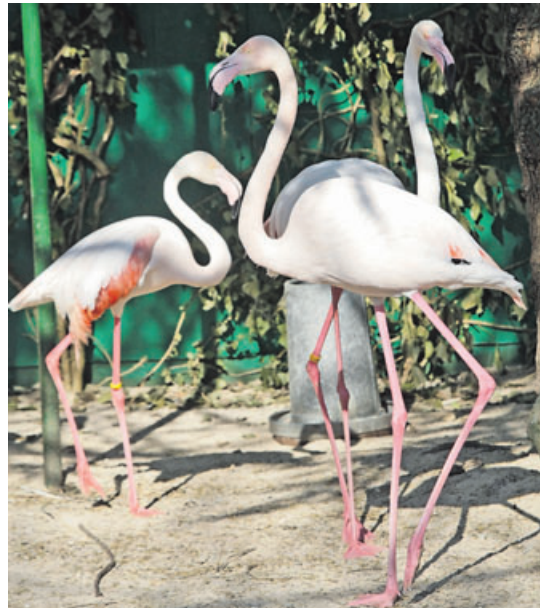
El flamenco común es uno de los atractivos del zoo.